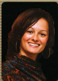
Urednice: Rajka Đević