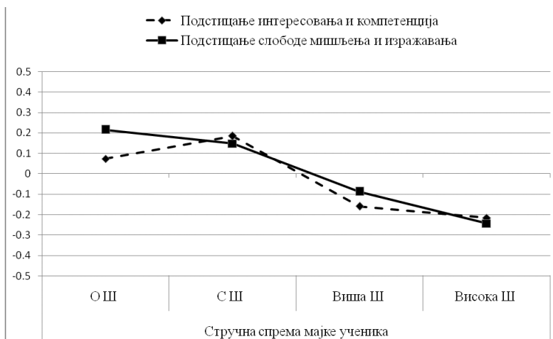
Графикон 1. Разлике у опажању наставничког подстицања интересовања и компетенција и подстицања слободe мишљења и изражавања у зависности од стручне спреме мајке ученика

Када је у реч о образовном нивоу оца, добијени су веома слични резултати. Утврђено је да ученици очева са високом стручном спремом опажају да наставници мање подстичу интересовања и компетенције него ученици очева са средњом стручном спремом ( p < ,05 ) (графикон 2). На димензији слобода мишљења и изражавања добијене су значајне разлике између свих група осим између ученика очева са високом и вишом стручном спремом ( p < ,05 ). Резултати показују да што је стручна спрема учениковог оца нижа, то је већи њихов доживљај да наставничково понашање подстиче слободу мишљења и изражавања.