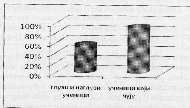
Графикон 2 – Писање двојног женског презимена (Олујић-Пешић) у диктату – поређење ученика који чују са глувим и наглувим ученицима

Узраст ученика, степен оштећења слуха и пол нису утицали на примењивање овог ортографског правила што потврђују и статистички подаци ( p < .348 , p < .456 , p < .134 ).