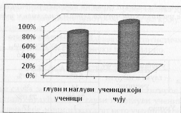
Графикон 1 – Писање властитог имена (Љубица) у диктату – поређење ученика који чују са глувим и наглувим ученицима