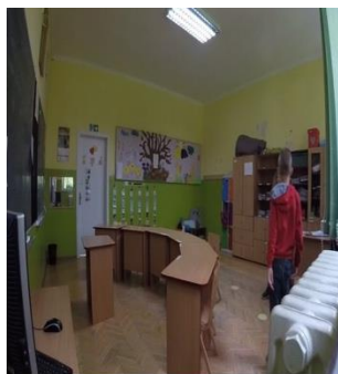
Слика 1: Учионица првог близаначког пара